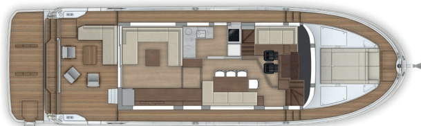
Pont principal avec 2 sièges pilotes