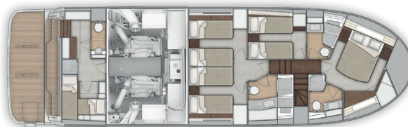
Pont inférieur 4 cabines