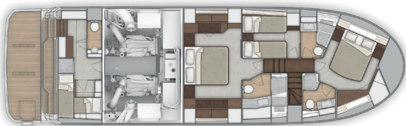
Pont inférieur 3 cabines